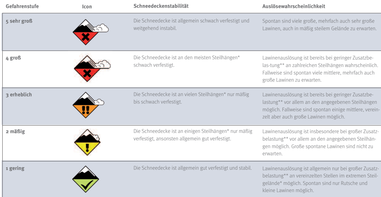
Ab. 1 Die EAWS Lawinengefahrenskala , nach der die europäischen Lawinenwarndienste (European Avalanche Warning Services, EAWS) arbeiten. Quelle: avalanches.org

Theorie. Ich bin zum LWD Bayern und jetzt beim LWD Tirol und arbeite an der Schnittstelle zwischen Forschung/Entwicklung und der operativen Lawinenwarnung.