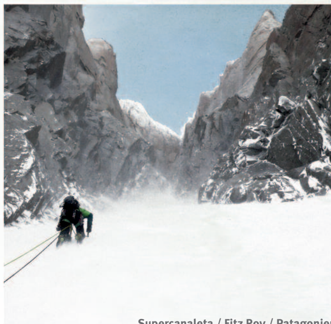
Supercanaleta / Fitz Roy / Patagonien