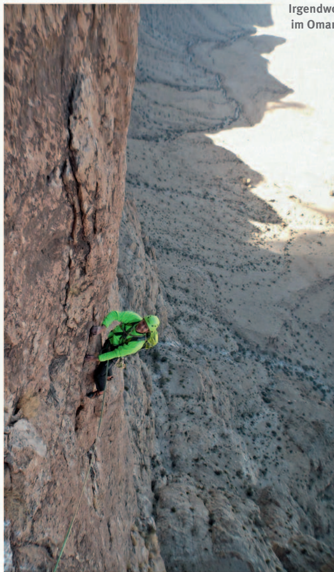
Irgendwo im Oman