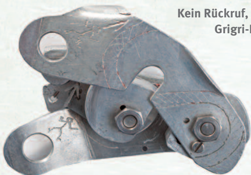
Kein Rückruf, sondern Grigri-Prototyp

■ BLACK DIAMOND Camalot & Camalot Ultralight Aufforderung zur Selbstinspektion bzw. freiwilliger Rückruf, da bei Camalots aller Größen (Mai 2015 bis März 2016 mit Herstellungscode 5133-6067) sowie Camalots Ultralight (November 2015 bis März 2016 mit Herstellungscode 5309-6061) die Achsen nicht korrekt vernietet sein könnten > https://warranty.bdel.com/CamalotRecall/Landing