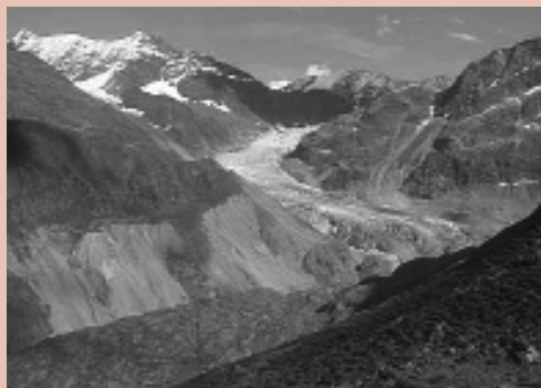
Der Gepatschferner, Ötztaler Alpen, im Jahre 1904 und im Jahr 2000