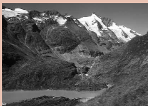
Die Pasterze, Hohe Tauern, im Jahre 1900 und im Jahr 2000