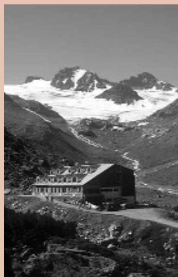
Aufnahme der Jamtal Hütte, Silvretta, vor 1929 und im Jahr 2001