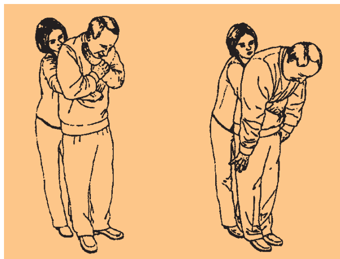
Beim „Heimlich Handgriff“ wird der obere Teil des Bauches unterhalb des Rippenbogens mit beiden Händen von hinten umfasst. Eine Hand wird zur Faust geballt und mit der anderen umgriffen. Zieht man die Hände schnell nach innen und oben kann ein Fremdkörper aus dem Mund herausgestoßen werden.