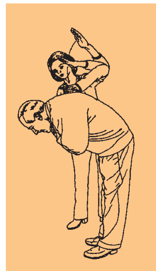
Beim sogenannten „Back Slap“ klopft man mit der flachen Hand bis zu fünf mal von hinten zwischen die Schulterblätter des Patienten.

schwierig herausstellt (z.B. bei fixen Zahnregulierungen)