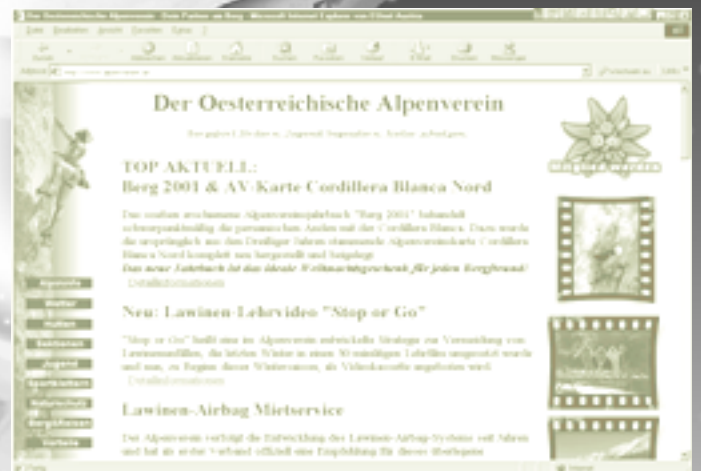
Oesterreichischer Alpenverein: http://www.alpenverein.at

Das World Wide Web (kurz WWW) ist eine gigantische Informationsquelle mit Daten, die auf zig-Tausenden von Computern („Webserver“) abgelegt sind. Diese Webserver sind über die ganze Erde verteilt und bilden so eine global vernetzte Bibliothek. Diese besteht aus unzähligen „Websites“, die wiederum jeweils nur eine oder auch mehrere Tausend Informationsseiten enthalten können, welche miteinander verbunden sind. Die erste Seite wird dabei als Startseite oder Homepage bezeichnet. Während sich eine Website an sich nicht ändert, können und sollen die an dieser Adresse eingerichteten Informationsseiten ständig neu eingerichtet und aktualisiert wer-