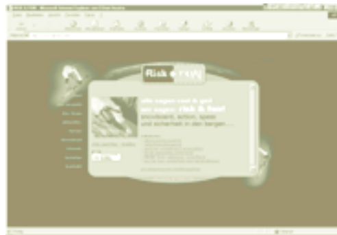
Projekt Risk&Fun: http://www.risk.fun.com/

... recherchiert von Christoph Höhenreich