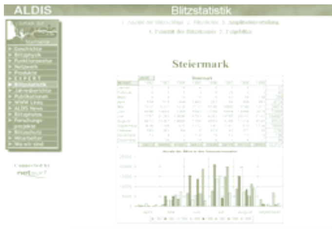
Blitzstatistik, Beispiel Steiermark: http://www.aldis.at/

Die gesuchten Informationen sind weltweit, jederzeit und sofort abrufbar. Selbst Expeditionen in abgelegenste Regionen der Erde bedienen sich heute moderner Medien zur Nachrichtenübermittlung. Via Laptop und Satellitentelefon kann beispielsweise eine Himalayaexpedition über ihren Fortschritt berichten und kommunizieren und sogar mit Digitalkameras gemachte Bilder ins WWW einspeisen. Andererseits kann sie wiederum auf Satellitenbilder und internationale Wetterberichte zurückgreifen, um eine Grundlage für die Taktik am Berg zu haben. Die Frage der mit dieser medialen Verknüpfung leider verlorenge-