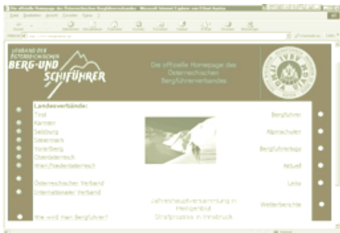
Verband der Österreichischen Berg- und Schiführer: http://www.bergfuehrer.at

henden Erlebniswerte wie Abgeschlossenheit oder Unabhängigkeit (die ja Teilaspekte einer derartigen Unternehmung sind) oder die möglichen Störeinflüsse von außen möchte ich an dieser Stelle nicht kommentieren. Nicht zu vergessen ist neben dem rein informativen Aspekt auch ein gewisser Unterhaltungswert durch teilweise sensationelle Präsentationen. So kann man das Gelände süditalienischer Vulkane dreidimensional studieren, wozu jedoch eine 3D-Brille Voraussetzung ist ( http://www.educeth.ethz.ch/stromboli/photos/stereo/index-d.html ), den Ausbruch des Ätna live mitverfolgen